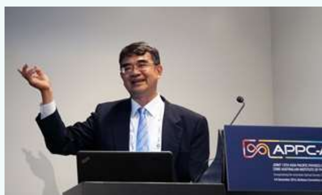
龙桂鲁教授做分会邀请报告