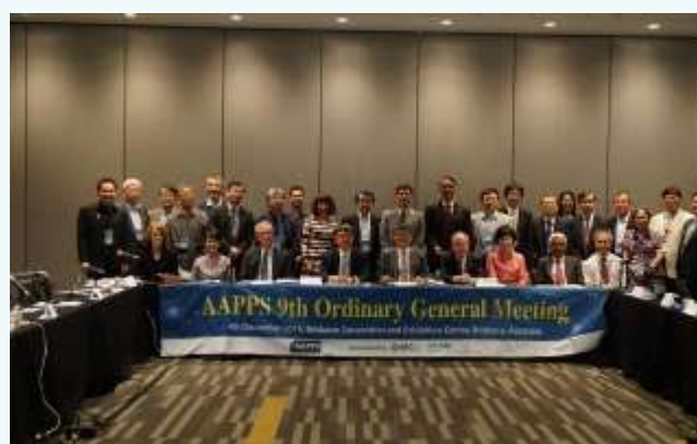
第九届 AAPPs 全体大会合影