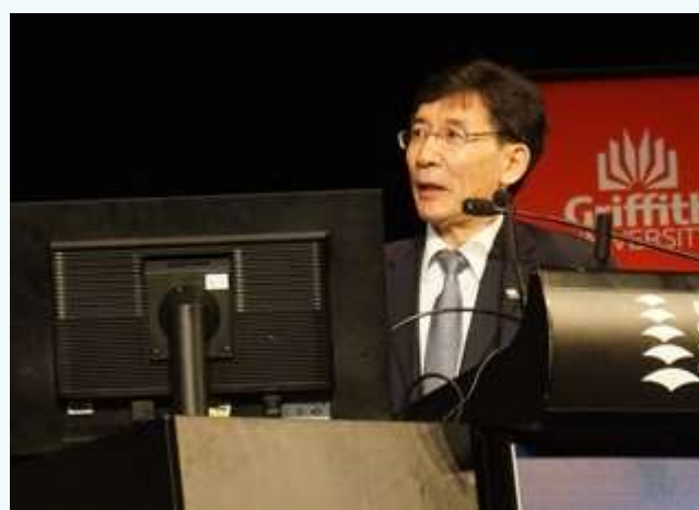
薛其坤教授做大会邀请报告