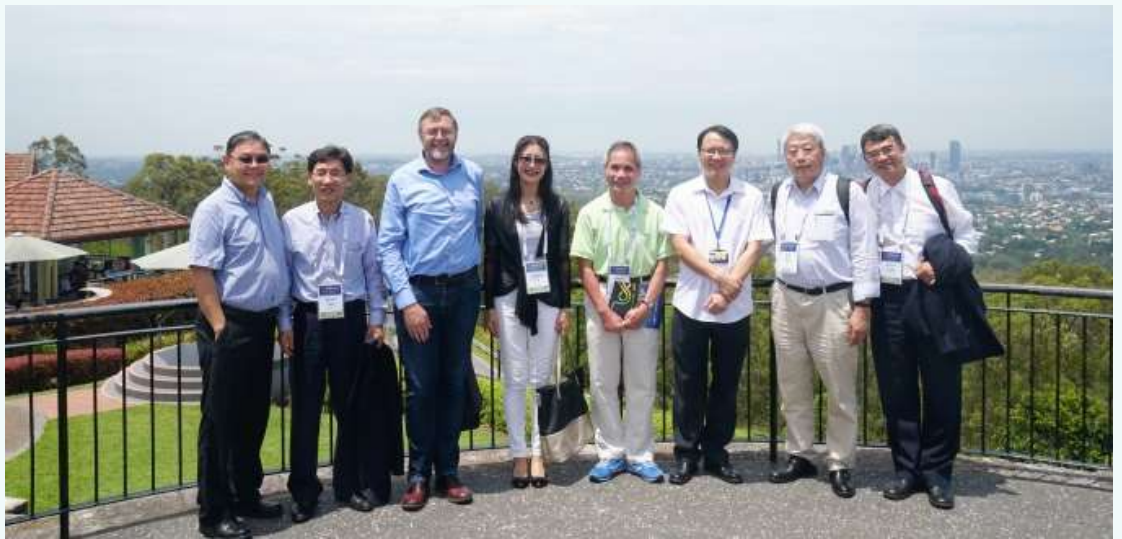
中国物理学会代表团访问昆士兰大学