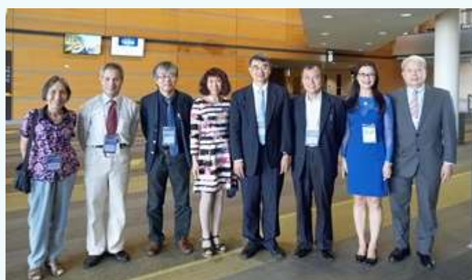
参加 AAPPs 全体大会的海峡两岸物理学会代表团

2016年12月4日，第九届亚太物理学会协会（AAPPs）全体大会在澳大利亚布里斯班举行。龙桂鲁教授当选为新一届 AAPPs 主席，朱星教授、金奎娟研究员连任理事。