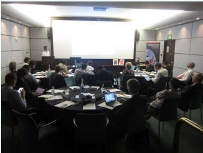
中英物理学会研讨会会场