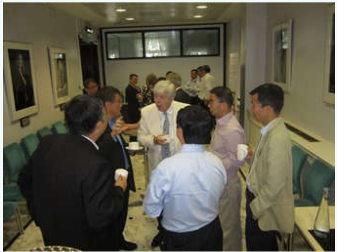
中英物理学家在研讨会期间进行交流