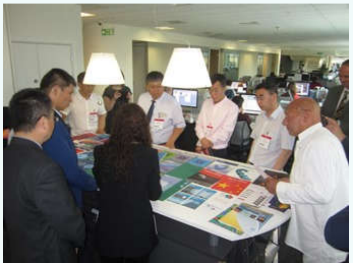
参观 IOPP 总部