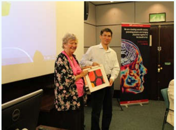
IOP 待上任主席 Dame Julia Higgins 向 CPS 理事长詹文龙赠送礼物