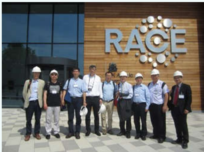
参观远程技术中心