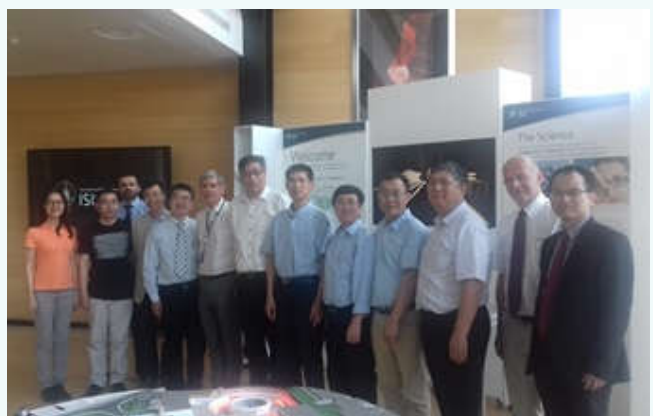
访问英国卢瑟福实验室