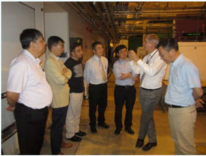
参观卢瑟福实验室