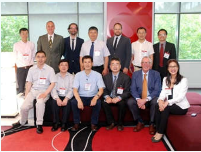
访问 IOPP 总部