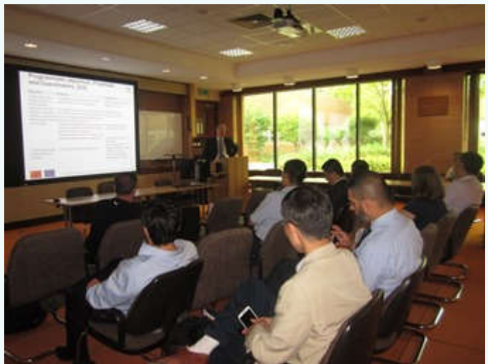
访问英国 Culham 科学中心